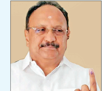
கணபதி ராஜ்குமார் பாராளுமன்ற உறுப்பினர்