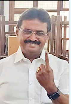
ந.கார்த்தி முன்னாள் சட்டமன்ற உறுப்பினர்