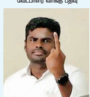
அண்ணாமலை பாஜக முன்னாள் தலைவர்