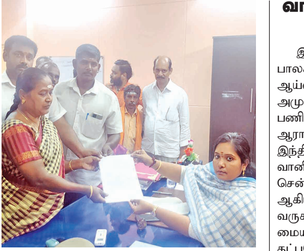
கோவை மாவட்டம் கஜூர் வட்டாட்சியர் அலுவலகம் முன்புள்ள அரக (கச.என்.422/15) இடத்தை அடுத்து மீறி ஆக்கிரமிப்பு செய்ய ஒரு தரப்பினர் முயற்சி செய்ததால் அனைத்து இந்த அமைப்பு மற்றும் பொதுமக்களும் கஜூர் வட்டாட்சியரிடம் மனு அளித்தனர். நடவடிக்கை எடுப்பதாக வட்டாட்சியர் கூறியதையடுத்து அனைவரும் கலந்து சென்றனர்.

கோவை நேரு நகரில் சந்திரகாந்தி பள்ளி பள்ளி அருகில் மருதம் செர்ரி பிளாசம் என்ற பெயரில் 39 அடுக்குமாடி குடியிருப்புகள் விற்பனைக்கு உள்ளன. இந்த வீடுகள் திடமான RCC கட்டமைக்கப்பட்ட அமைப்பு, பிராண்டட் விட்டர், பைட்டைல்ஸ், பால்கனி, பயன்பாடு மற்றும் கழிப்பறைகளுக்கான ஆண்டி ஸ்கிட் டைல்ஸ், ஸ்பளஷ் டேங்க், ஹெல்த் ஃபாசெட், பனபளப்பான ஷட்டருடன் கூடிய நல்ல தரமான மரத்தால் ஆன கதவுகள், அனைத்து கழிப்பறைகள் மற்றும் வீட்டு உபயோகத்திற்கு ஆழ்துளை கிணறு நீர் மற்றும் சமையலறைக்கு மட்டுமே மாநகராட்சி நீர் விநியோகம், கார் பார்க்கிங் பகுதியில் கிரானோலித்திளம், அனைத்து படுக்கையறைகளிலும் நல்ல தரமான மாடுலர் சுவீட்சுகள் & ஸ்பிஸிட் ஏசி வசதிகளுடன் கூடிய மறைக்கப்பட்ட வயரிங், 8 பயணிகள் தானியங்கி லிஃப்ட் உள்ளிட்ட வசதிகளுடன் வருகிறது. மேலும் விவரங்கள் அறிய 92444 05632/ 92444 01632 எண்களில் தொடர்பு கொள்ளலாம்.